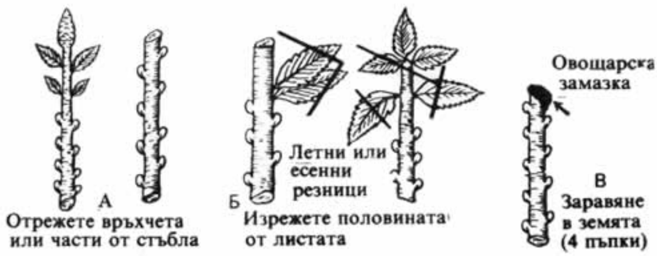
Фиг. 1 Резници