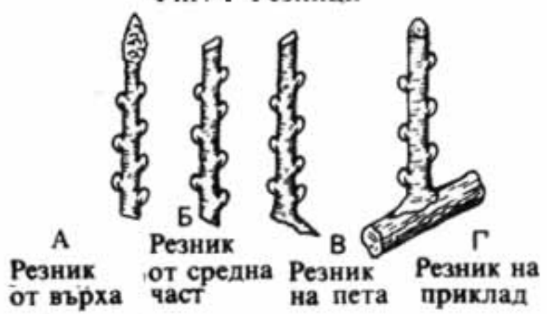
Фиг. 2. Различни видове резници