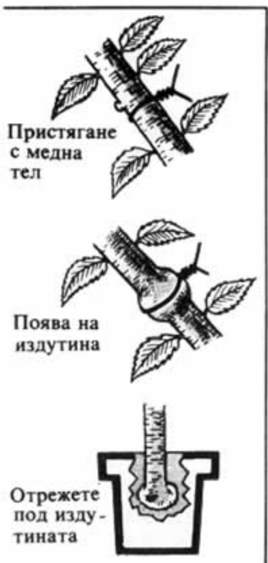
Фиг. 3. Трудно вкореняващи се резници